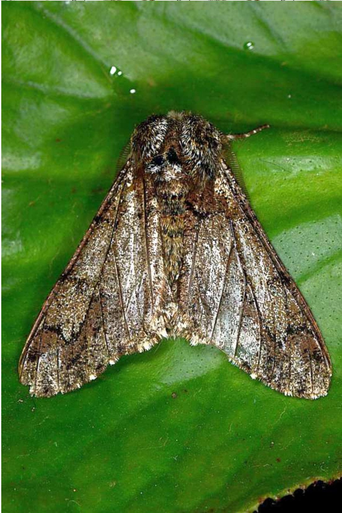
Biston strataria (Hufnagel, 1787)