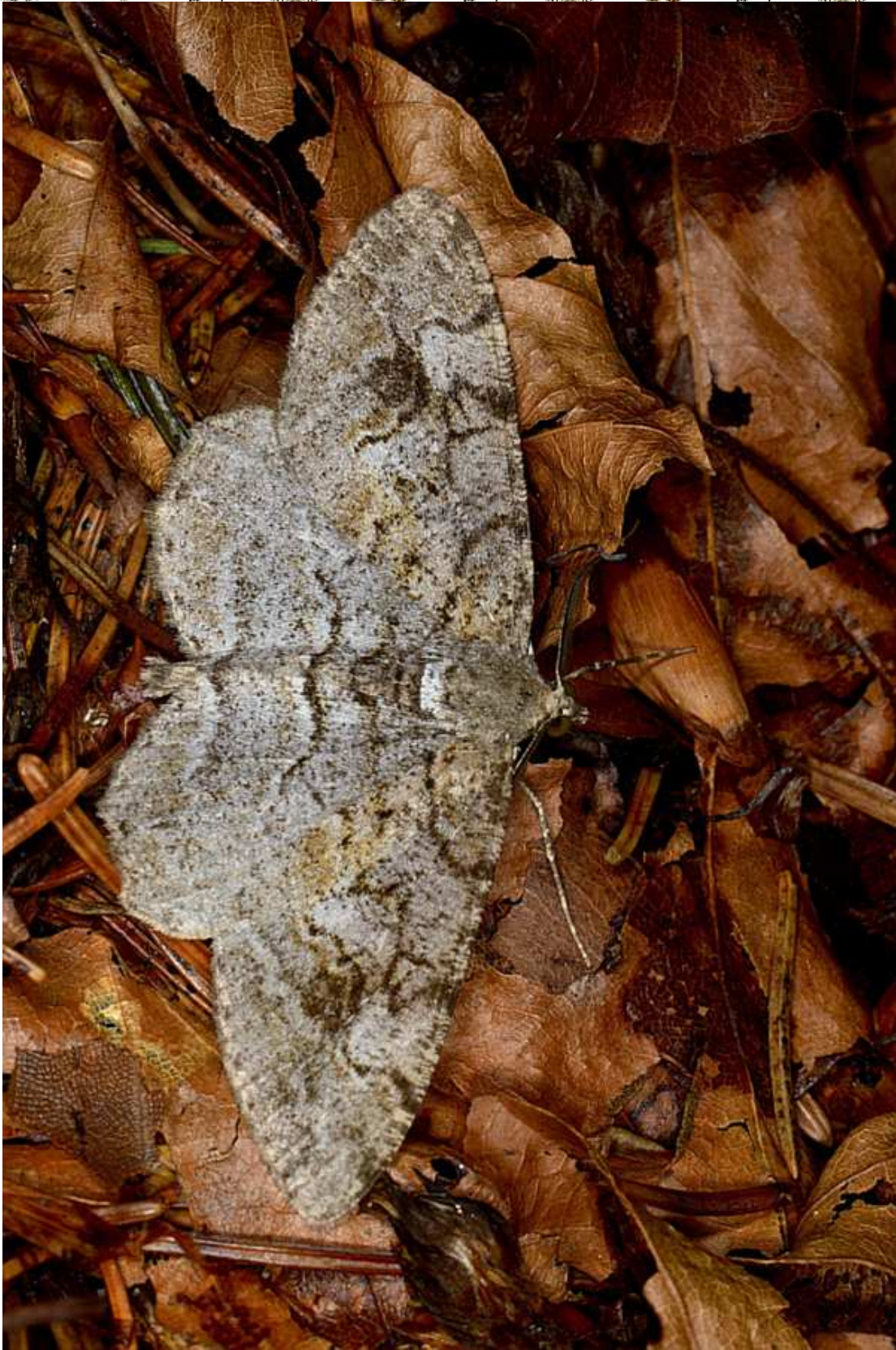
Alcis repandata (Linnaeus, 1758)