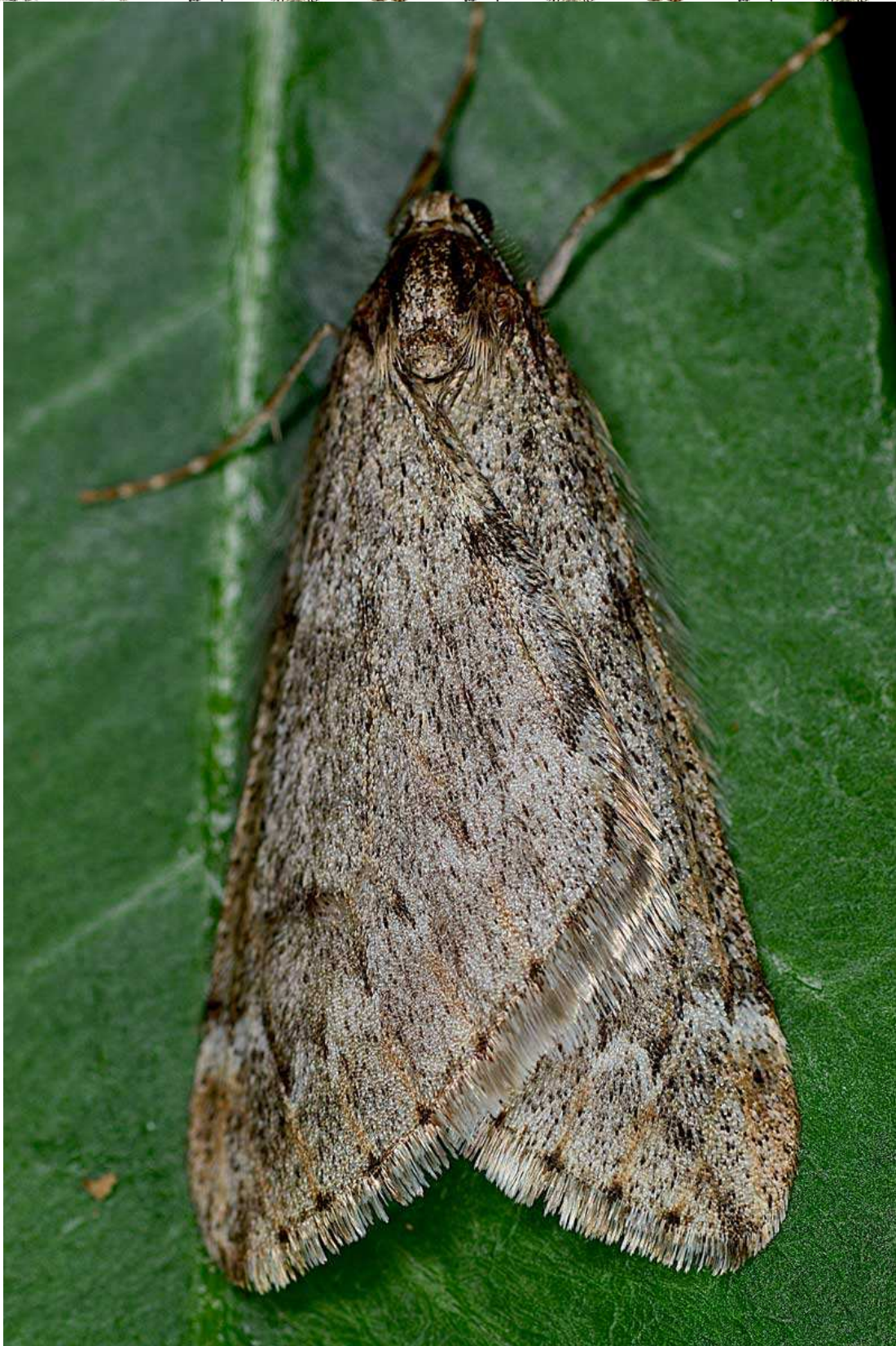
Alsophila aescularia (Denis & Schiffermuller, 1775)