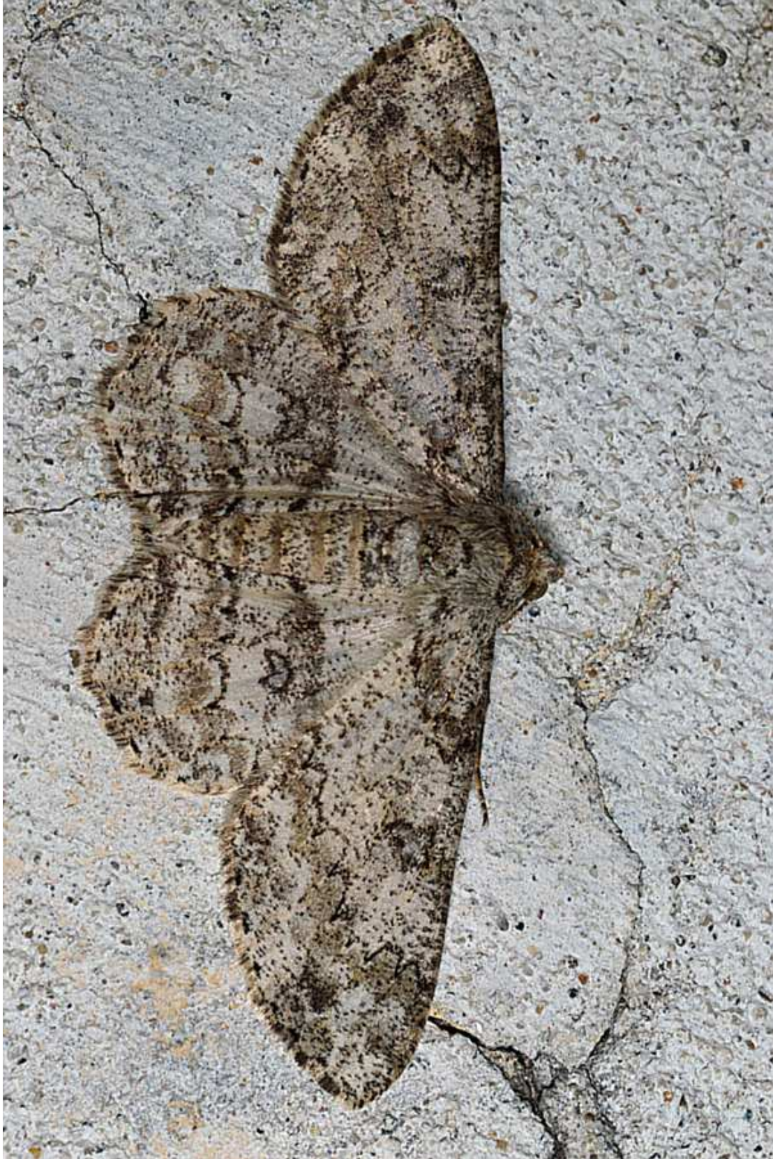
Ascotis selenaria (Denis & Schiffermuller, 1775)