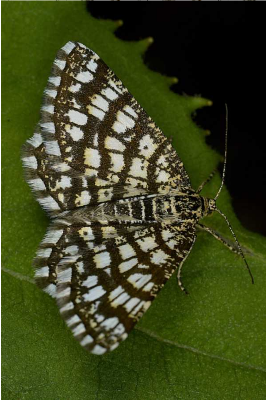
Chiasmia clathrata (L. 1758)