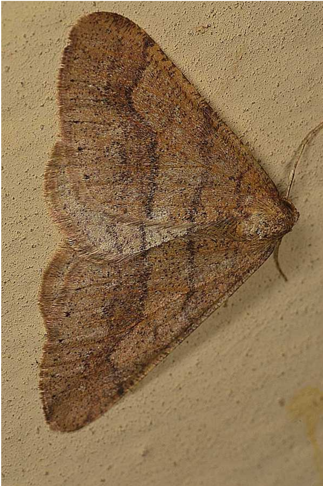
Agriopsis marginaria (Fabricius, 1776)