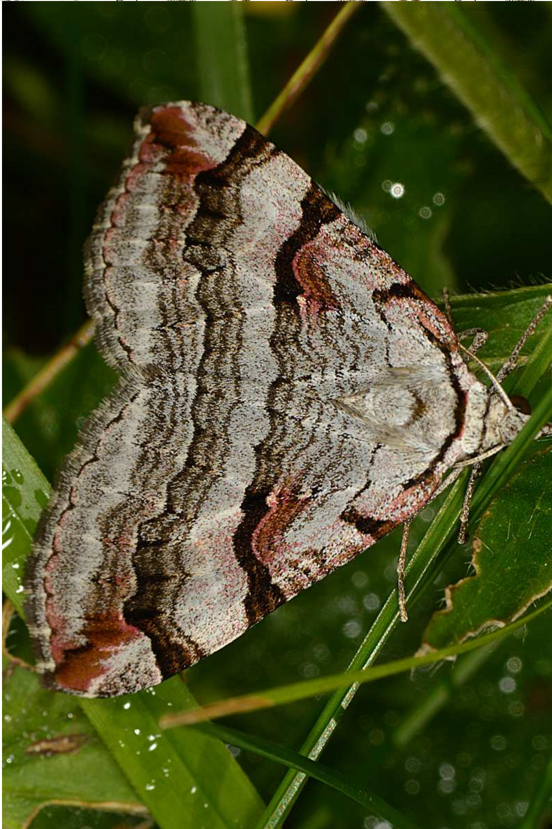
Aplocera praeformata (Hubner, 1826)