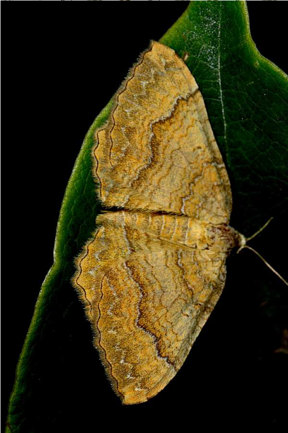
Camptogramma bilineata (L. 1758)