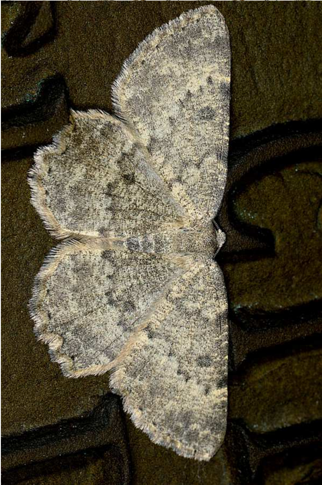
Charissa glaucinaria (Hubner, 1799)