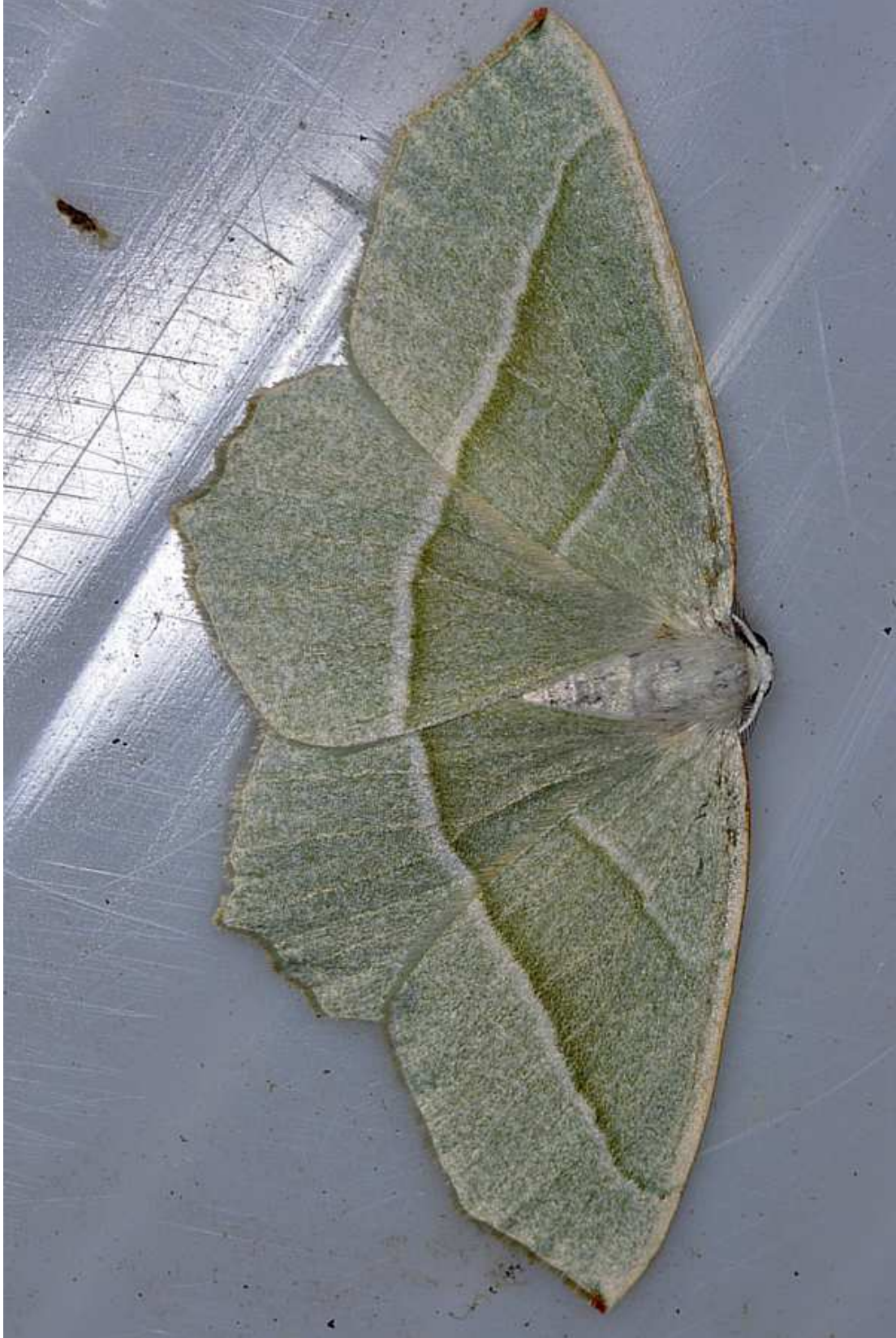
Campaea margaritaria (L. 1761)